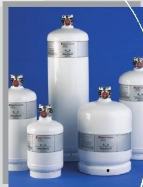
Kidde WHDR rendszer

A Kidde WHDR rendszerbe történő befektetés nem csak a UL Standard 300, NFPA 96, NFPA 17A szabványoknak és a biztosítói előírásoknak való megfelelést garantálja, de egy tüzeset megsemmisítő következményeitől is megvédi konyháját.